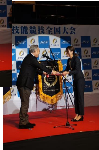
女性の部 最優秀賞受賞者