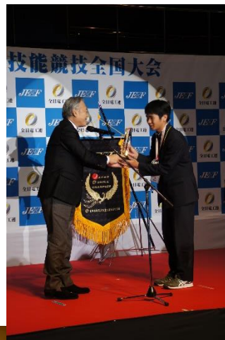
高校生の部最優秀賞受賞者