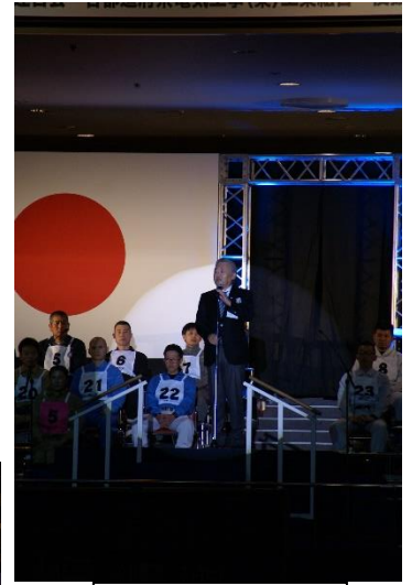
開会式（主催者挨拶）