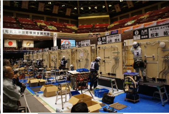
技能競技中の会場の様子