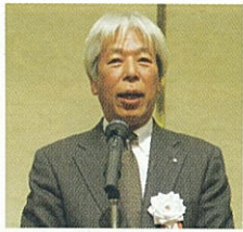
あいさつする 向山会長