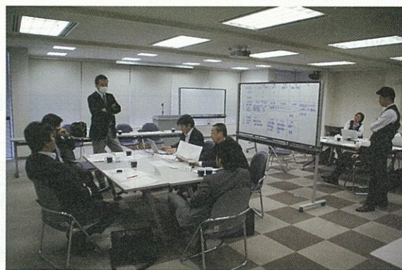
青年部事業の方向性を検討

提言書項目の実施に向けて検討 全国青年部協議会は2月5日、青年部事業政策・全日電工連事業受託(アカデミー)の創設などワーキンググループ(WG)を全日電工連会館で開催した。WGは、「提言書」項目の実行に向けた調査・研究と実行計画の策定とした。