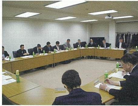
平成25年度事業計画案などを審議