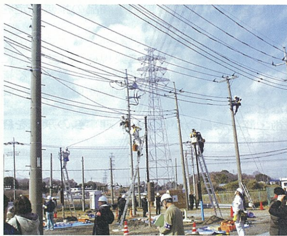
安全施工を第一に競技に取り組む選手

東日本大震災の影響で2年ぶりに開催された今年大会では、災害復旧を新しいテーマとして実施... 競技は、9チームが参加... 調査業務では、点検や絶縁抵抗、接地抵抗、電圧測定などに加え、お客さま対応も評価の対象となった。