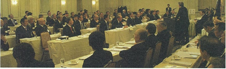
課題解決に向けて審議

全日電工連は2月21日、第85回臨時総会、第3回政治連盟通常総会を仙台市内で開催し、合同会議の全議案が承認された。会議後には、各工組理事長と全日電工連の役員が意見交換会を開催し、発送電分離について自由討論が行われた。 全日電工連は、強い組織を目指しスピーディーに結果を出すとともに業界の発展・安定化に向けてより地道に強力な活動をしていく方針だ。