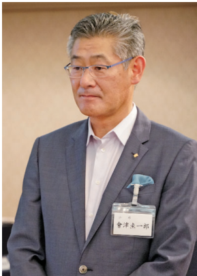
受賞者代表の會津理事長