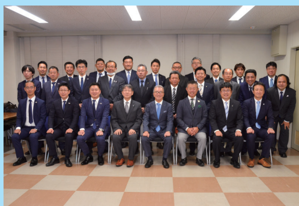
九州工販若手意見交換会