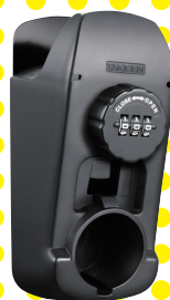
ダイヤルロックタイプ [CP-458-D]