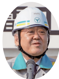
あいさつする米沢会長

北陸電気工事組合連合 電工組の組合員の中から、外線工事、引込線工事、富山市の北陸電力 事とも3名1組で1チーム、合計6チームの18名が日頃培った安全工事技能を競い合った。競技は、外線工事の部が「飛来物接触による高圧線断線と不良C F遮断器復旧工事」、引込線工事の部が「引込線無停電」の審査を待つ時間を待たされた。