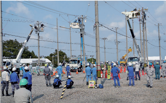
競技に臨む選手たち

北陸電気工事組合連合 電工組の組合員の中から、外線工事、引込線工事、富山市の北陸電力 事とも3名1組で1チーム、合計6チームの18名が日頃培った安全工事技能を競い合った。競技は、外線工事の部が「飛来物接触による高圧線断線と不良C F遮断器復旧工事」、引込線工事の部が「引込線無停電」の審査を待つ時間を待たされた。