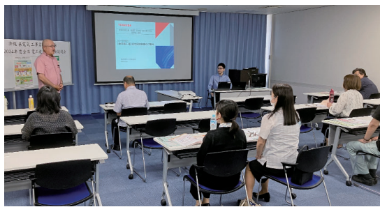
制度の特色や概要を解説

認定保険制度である損害保険制度（第三者・業務災害補償）、生活総合保険制度、取引信用保険制度、グループ共済制度の募集開始に先立ち、東芝保険サービス・全日電工連総合サービスが工組所属の組合員に各種保険の概要や応募スケジュール等を説明した。