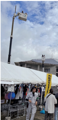
試乗体験会の様子