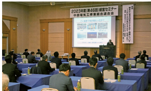
エネルギーについて講演

など約70名が参加し、講師を招いての講演会を行った。全日電工連の重点事業と全日電工連政治連盟の概況を報告。全日電工連の令和5年度事業の方向性と重点事業、各委員会の主な取り組み事項、政治連盟の主な活動成果が報告された。講演会の演題は、「歴史から見る日本のエネルギー問題について（これから日本のエネルギーを考える）」。ユ会は、セミナーの成功を祝し、来賓の方々とともに参加者全員で交流を図った。