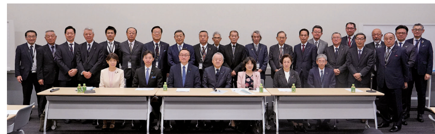
当会参加者など集合写真

電気工事技術者が実務をしながら年1回の受験機会では、取得の動機、モチベーションの面でも難しく、年2回の受験機会をいただきたい。 電気工事士等の無資格者に対する資材販売時の免状提示ならびに法改正について 2017年29保電安第34号電気保安室長名で、DIY協会あて「消費者等による資格者工事防止について」の協力依頼が発出され、販売店レジにボスター掲示の指導もなされているが、無資格者施工が実態となっている。有名無実の現況から、電気用品安全法の新設追記および販売時の免状確認の義務化を要望する。 入札制度・スライド条項の拡大指導・公共工事労働単価見直し要望 (1) 最低制限入札価格の設定を要望 (2) 公共工事に係るスライド条項の適用範囲を民間に適用指導強化要望 このうち電気工事は「ライフライン・設備区分」となり大いに歓迎するところであるが、国内法の適用を民間工事に拡大指導をお願いする。 厚生労働省「つなぐ事業」対象の拡大要望 高校生向けの「つなぐ化事業」については業界PR、入職者拡大に大いに活用している。小学生に対する「社会科の地域社会理解」、中学生に対する「エネルギーの理解」のカリキュラムの応用として実業の教育がさらに理解促進効果があるものと考えている。 特定技能外国人の施工可能範囲の設定要望 文科省（特に大学・防衛施設等）は入札制限価格がない状況であり、低入札調査はあるものの品質確保の観点から「最低制限入札価格の設定」を要望する。 建設分野の業務区分は、令和4年8月閣議決定によれば従来の19業務から3区分に簡素化され、建設業務は3区分に統合し、業務区分が拡大される見込みとなった。