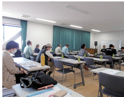
説明会の様子（上・新潟、下・和歌山）

全日電工連は今年の5月から電気工事会社のDX推進に役立つ新サービス「DENNUP（デンナップ）」を提供している。 説明会は三部構成で、①DENNUP導入のメリット②サービスの紹介③導入までの流れなどをDX分科会メンバーとDENNUP関連企業の担当者がよりサービスの魅力が伝わるよう広くPRしていく考えだ。 村吉伸座長は、DENNUP組合員向け対面説明会を全国で展開して、さらに理解を深めたいと意気込みを述べた。