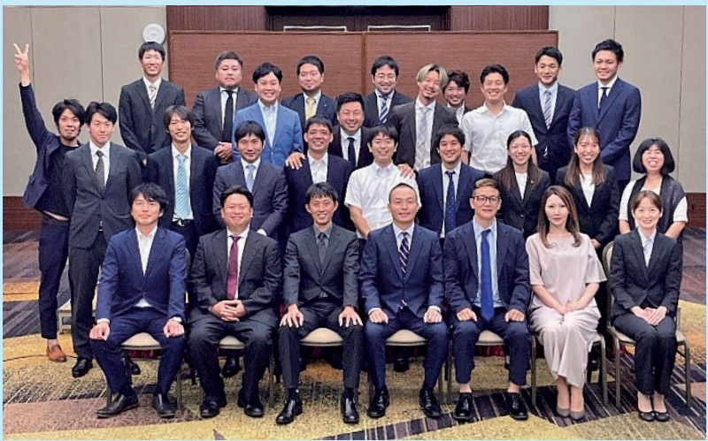
参加者で記念撮影