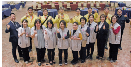
マッチングパーティー