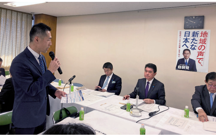
要望事項を政策懇談会へ提出

◆予算措置に関する要望 ・補助金制度の拡充 ・政策措置に関する要望 ・第一種電気工事士受験機会の拡大等