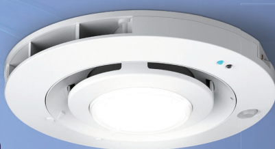
人感センサー内蔵形（照明付）