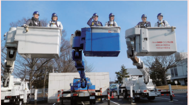
業界理解促進事業

現在25名を超える会員数となった女性部。今年も会員みんなが公平にチャレンジできる1年にしていきたいと思っています。