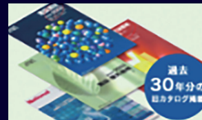
過去30年分のカタログ検索