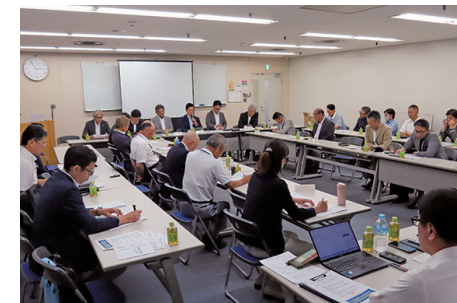
今後の組合を考える研修会