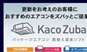
更新をお考えのお客様に、おすすめのエアコンをズバッとご提案。