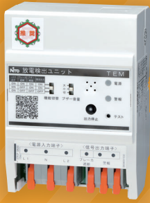
分電盤取付タイプ (単相3線専用)

お問い合わせ先 〒480-1189 愛知県長久手市蟹原2201番地 お客様相談室/ TEL: (0561) 64-0152