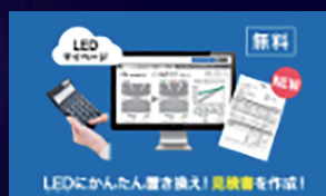
LEDにかんたん置き換え！見積書を作成！