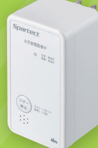
コンセントタイプ