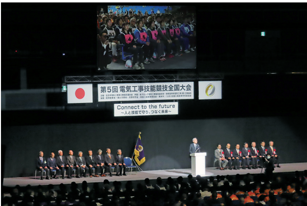
熱戦が繰り広げられた技能競技全国大会