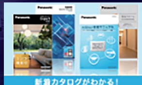
新着カタログがわかる！