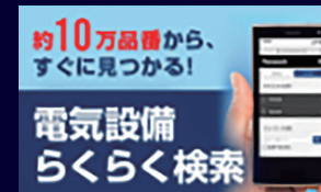
約10万品目から、すぐに見つかる！