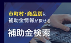
市町村・商品別に補助金情報が探せる